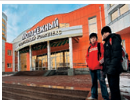
В КУРГАНЕ ПОЯВИЛСЯ МОЛОДЕЖНЫЙ СПОРТИВНЫЙ КОМПЛЕКС, А В ЧЕЛЯБИНСКЕ — СУПЕРСОВРЕМЕННАЯ ЛЕДОВАЯ АРЕНА «ТРАКТОР».