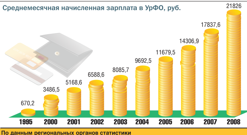
Среднемесячная начисленная зарплата в УрФО, руб.

По данным региональных органов статистики