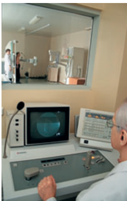
НА ВООРУЖЕНИЕ МЕДИКОВ ПРИХОДИТ СОВРЕМЕННАЯ ТЕХНИКА.

В течение года после открытия в центре намерены сделать одну тысячу операций, в последующем — увеличить их до трех тысяч. Коллектив сформирован из опытных врачей, в том числе приглашенных из сопредельных и дальних регионов России. Многие накануне прошли дополнительную профессиональную подготовку.