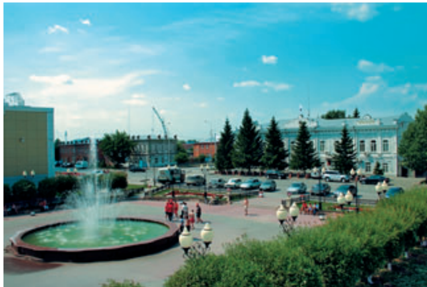
ЦЕЛЬ СТРАТЕГИИ — ЯЛУТОРОВСК ДЛЯ РАБОТЫ, ЖИЗНИ И ОТДЫХА.

Чтобы сказанное не выглядело голословным, следует привести несколько показательных цифр и фактов. В десять раз — в сопоставимых ценах — увеличился объем инвестиций в местную индустрию. По производству промышленной продукции на душу населения город занял второе место среди муниципальных образований области, а по объему бытовых услуг — третье. В два раза выросли темпы строительства