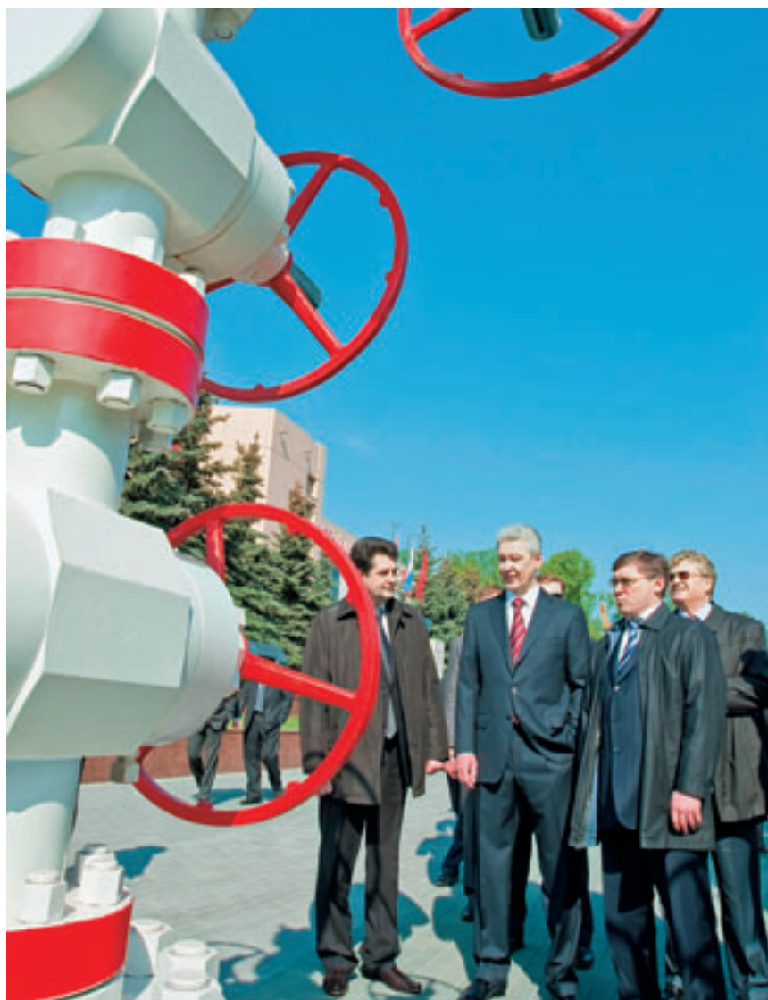
ЗАДАЧА ВЛАСТИ — ПОДТОЛКНУТЬ УРАЛЬСКИЕ ПРЕДПРИЯТИЯ К КООПЕРАЦИИ.

Машиностроению — одной из базовых отраслей экономики края — правительство области по-прежнему не отказывает в господдержке. Она, в частности, выражается в содействии модернизации производства, получении кредитов, предоставлении нефтегазовым компаниям 8-процентной компенсации от стоимости приобретенной продукции машиностроителей.