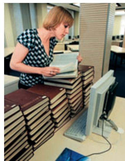
ПРИ ОЦИФРОВКЕ И ТЯЖЕЛЕННЫЙ ТОМ СТАНЕТ НЕВЕСОМЫМ.

ния, включая роскошную базу патентно-технической документации, нормативной, другой специальной литературы. «Менделеевка» намерена стать не только культурным, но и научно-информационным центром Западной Сибири.