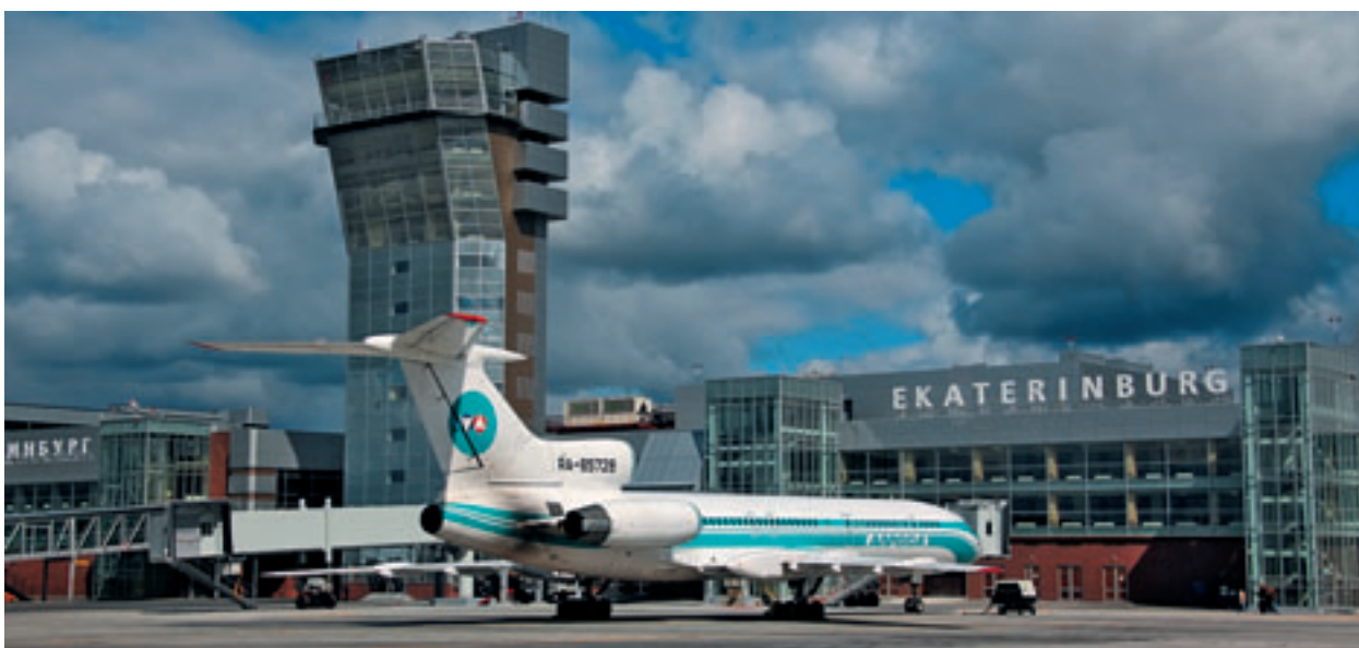
В МЕЖДУНАРОДНОМ АЭРОПОРТУ КОЛЬЦОВО ПОД ЕКАТЕРИНБУРГОМ СДАЛИ В ЭКСПЛУАТАЦИЮ КОНТРОЛЬНО-ДИСПЕТЧЕРСКИЙ ПУНКТ.