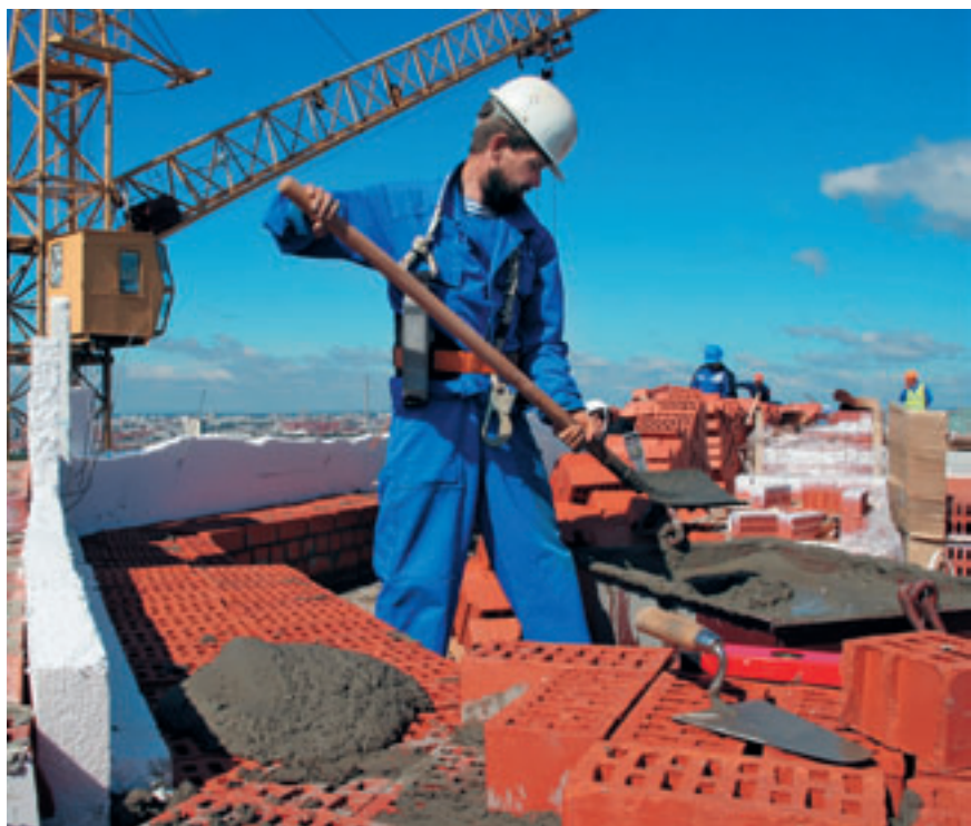
НОВЫЕ МЕХАНИЗМЫ ФИНАНСИРОВАНИЯ, В ЧАСТНОСТИ, СОЦИАЛЬНОЕ КРЕДИТОВАНИЕ, ПОЗВОЛЯТ ЗНАЧИТЕЛЬНО ПОВЫСИТЬ СПРОС НА ЖИЛЬЕ В НОВОСТРОЙКАХ.

Удешевить жилищное строительство помогут новые схемы финансирования