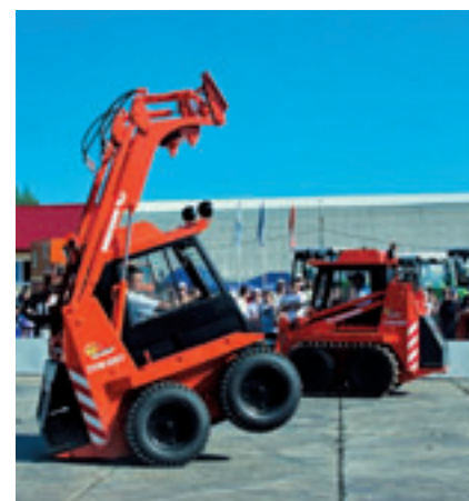
ПОГРУЗОЧНАЯ УНИВЕРСАЛЬНАЯ МАШИНА ТВОРИТ ЧУДЕСА.

Сегодня Уралвагонзавод вплотную занимается реализацией проекта по диверсификации производства: по конструкции ОАО «Спецмаш» создаются два образца мобильной установки, предназначенной для текущего и капитального ремонта