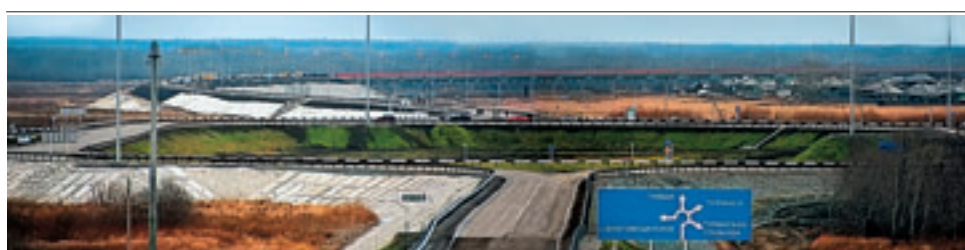
ПОД ТУРИНСКОМ СВЕРДЛОВСКОЙ ОБЛАСТИ ЗАВЕРШИЛОСЬ СТРОИТЕЛЬСТВО АВТОРАЗВЯЗОК И МОСТА ЧЕРЕЗ ТУРУ.