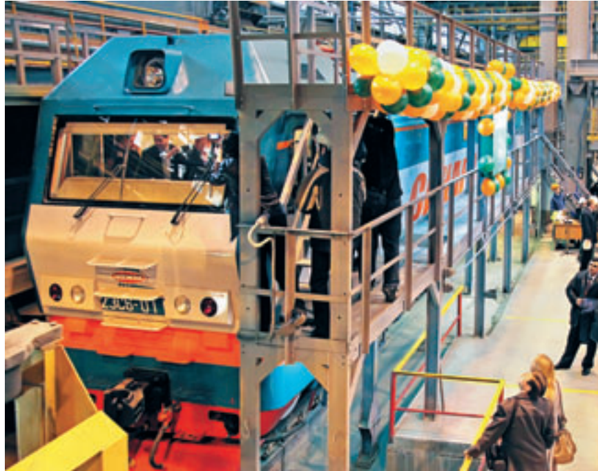
В СОЗДАНИИ УРАЛЬСКОГО ЭЛЕКТРОВОЗА УЧАСТВУЮТ НЕСКОЛЬКО ДЕСЯТКОВ ПРЕДПРИЯТИЙ СВЕРДЛОВСКОЙ ОБЛАСТИ. К СОЖАЛЕНИЮ, ПРОГРАММ МЕЖРЕГИОНАЛЬНОЙ ПРОМЫШЛЕННОЙ КООПЕРАЦИИ В УРФО ПОКА НЕТ.

Обладая собственной отраслевой спецификой, все субъекты Федерации, вошедшие в УрФО, тем не менее довольно рано задумались о необходимости выработки стратегических планов развития своих территорий. Одним из первых в стране такой фундаментальный региональный документ, напомним, создали на Среднем Урале: в конце 2002 года была принята Схема развития и размещения производительных сил Свердловской области на