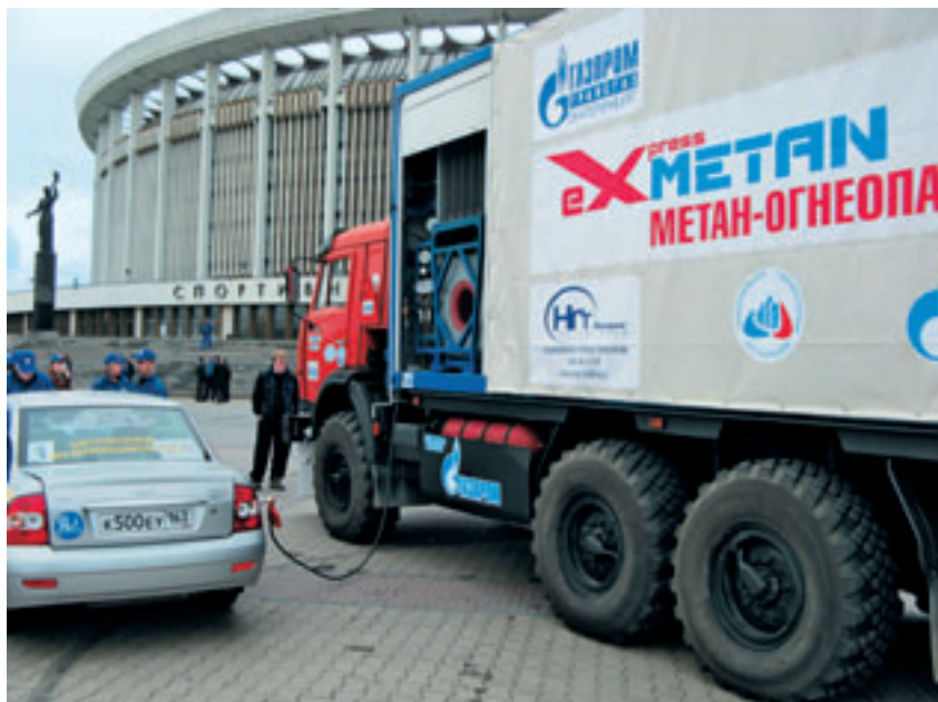
АВТОМОБИЛЬНАЯ ГАЗОНАПОЛНИТЕЛЬНАЯ КОМПРЕССОРНАЯ СТАНЦИЯ ПОЗВОЛЯЕТ ОРГАНИЗОВАТЬ ЗАПРАВКУ ТРАНСПОРТА В ЛЮБОМ МЕСТЕ.

Высокая работоспособность, надежность и безаварийность газотранспортной системы газопроводов являются главными задачами предприятия. Ответственность,